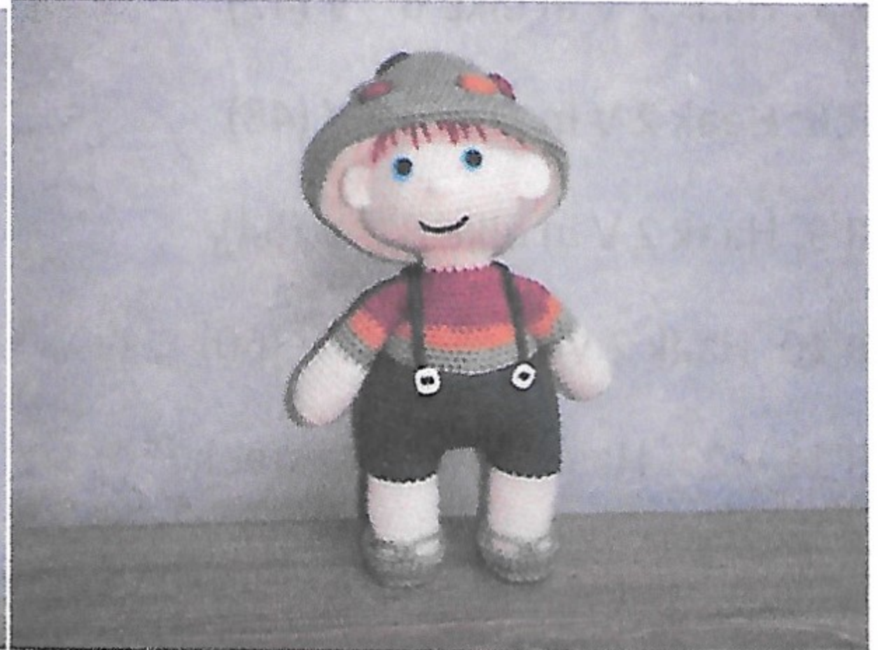
Korte beentjes en armen